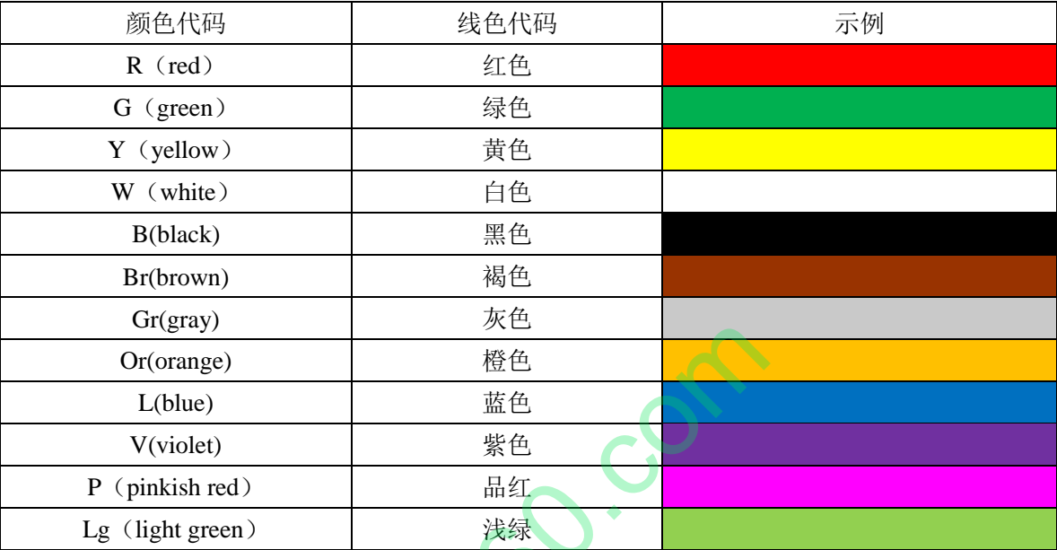
表 1-2 导线颜色代码

如果导线颜色标注为上述表格 1-2 之外的代码，则表示线束为双线条，即第一个字母显示导线底色，第二个字母显示条纹色。